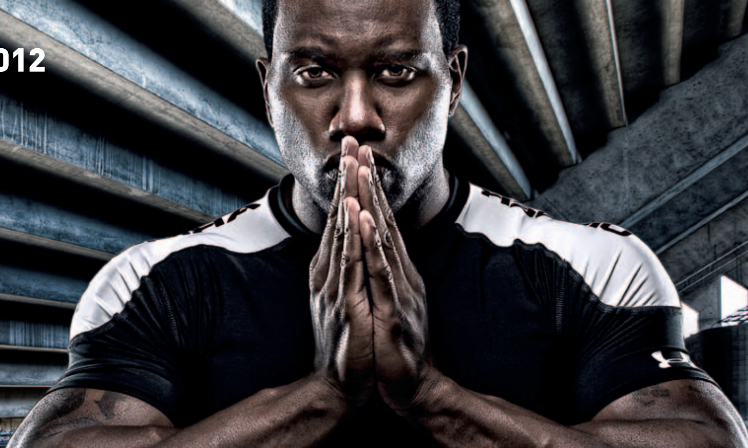
ГРАФИК ВЫХОДА 2012