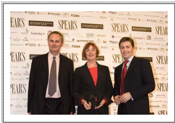
Презентация SPEAR'S Russia Лондон, 29 сентября 2008 года