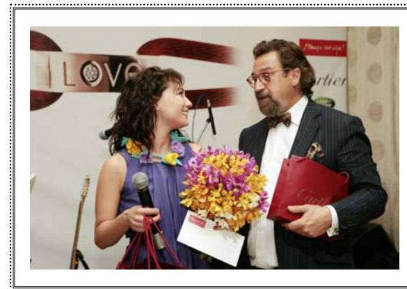
Благотворительный вечер ALL YOU NEED IS LOVE Москва, 16 июня 2009 года