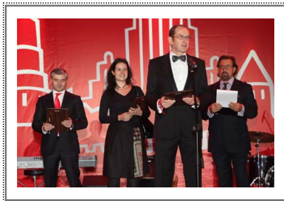
Церемония вручения ежегодной премии SPEAR'S Russia Wealth Management Awards 2010 Москва, 25 ноября 2010 года