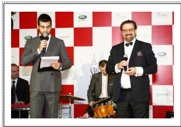
Церемония вручения ежегодной премии SPEAR'S Russia Wealth Management Awards 2009 Москва, 26 ноября 2009 года