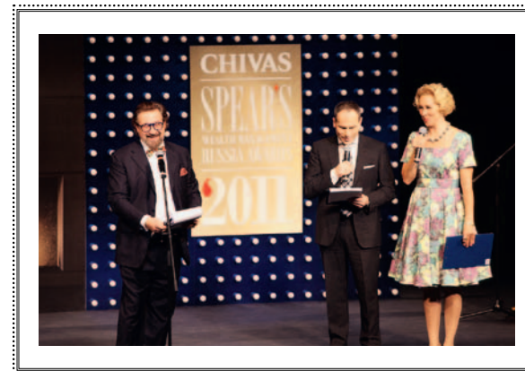
Церемония вручения ежегодной премии CHIVAS SPEAR'S Russia Wealth Management Awards 2011 Москва, 17 ноября 2011 года