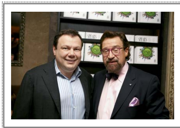
Презентация SPEAR'S Russia Москва, 15 октября 2008 года